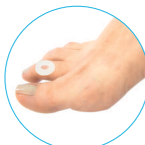
Oval Pequeño CON PERFORACIÓN PARA CALLOS

Indicaciones: Afecciones diversas en el pie.